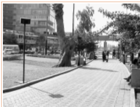
park-o-bahn en el parque central de miraflores

Recolección de artistas, dividir el tiempo, dividir 24 horas en forma estratégica, horarios que condensen nuestra rutina y muy asociados a la progresión de luz, nuestro día, nuestra vida, sonidos que sorprenden nuestro casual o rutinario pasar; sonidos que se agregan a los ya presentes e inherentes al medio —del tránsito, principalmente— y el sonido propio del parque, aves sobre todo. No era la idea preponderar y “usurpar” el espacio, sino tal vez ornarlo, añadirse e integrarse; y en cierta forma visual se trataba de embovedar mas no de aislar un espacio, en este caso la vía central del parque, su influencia en el ambiente público.