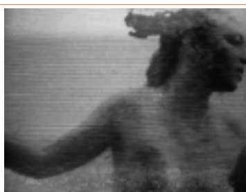
mona hatoum: changing parts

La colección pluridisciplinaria e internacional del Museo Nacional de Arte Moderno-Centro de Creación Industrial del Centro Pompidou, comprende 50 000 obras (pintura, escultura, arte gráfico, fotos, arquitectura, diseño, cine), incluyendo una colección significativa de obras en video, escogidas y presentadas por primera vez en el Perú, durante el 6 Festival Internacional de video/arte/electrónica.