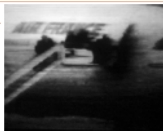
johan grimompmez: dial H-I-S-T-O-R-Y